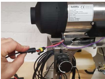
1) Frakobl/forbind strøm

3. Tryk en gang på blæserknappen "1" inden for 5 sek. Dette aktiverer servicetilstand, der er angives med gul og grøn lysdiode TIL på betjeningsmodulet