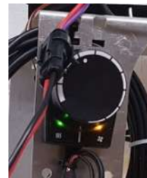
3) Grøn og Gul diode bekræfter Servicetilstand