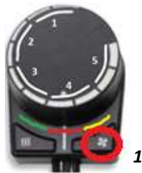
2) Tryk på "Blæser" inden for 5 sekunder