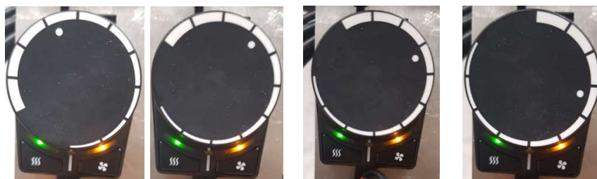
1) Vælg trim indstilling: Trim 0

Brug en kaliberet CO-måler til at foretage målingerne. Det er nødvendigt at slukke varmeren helt for at foretage trim.