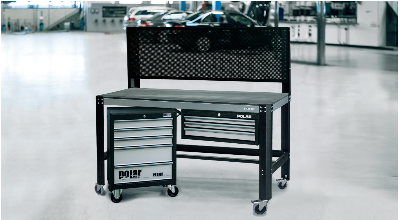
1300-1500 ARBEITSTISCH HÖHENVERSTELLBAR. 1000 KG STATISCHE BELASTUNG.